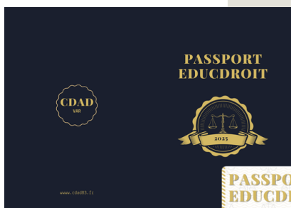
visuel CDAD VAR - MZ